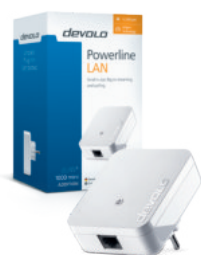
dLAN® 1000 mini Ampliación