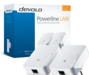
dLAN® 1000 mini Starter Kit